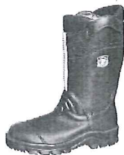
Rangers réf. 33323E: